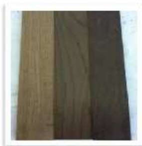
Niveles de tostado (medio, medio plus y fuerte)

Origen: Roble Francés curado al aire 18 meses